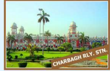
CHARBAGH RLY. STN.